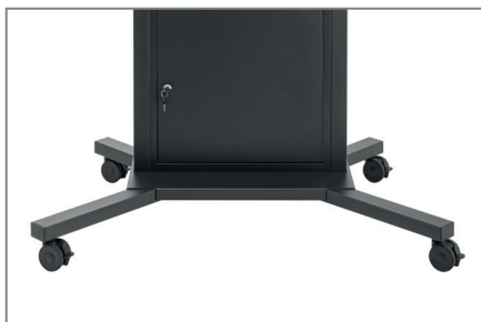
hochwertige Lenkrollen sorgen für Mobilität

Optional steht eine höhenverstellbare Kameraaufnahme (Lift Pro Camera Holder Black - Art.-Nr.: 8902) zur Verfügung sowie ein Bluetooth-Adapter zur Steuerung des Lifts mittels App (Art.-Nr.: 8904).