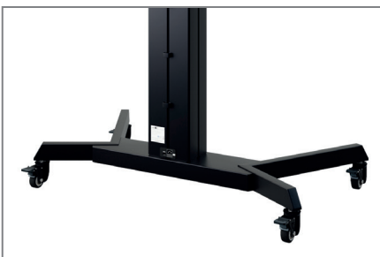
Schwerlastrollen mit Feststellbremse