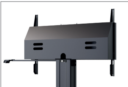
optional: abschließbare Rückabdeckung