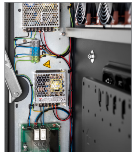
fachgerechte Verkabelung und Absicherung nach VDE (E-Check)