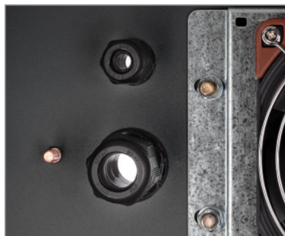
Kabeldurchführungen mit Dichtung