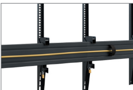
Kabelmanagement mittels Kabelclips