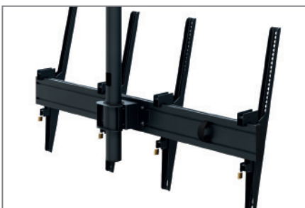
Anpassbar dank modularer Bauweise