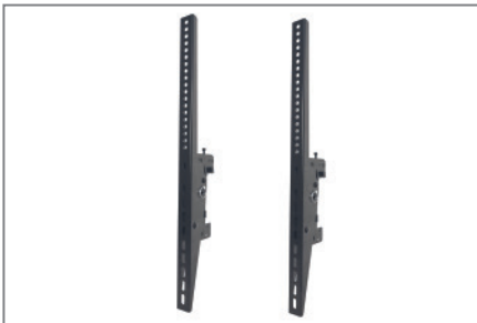
VESA max. 400 x 600 mm

Die Komplettlösungen sind mit den Einzelkomponenten der comPROnents®-Serie uneingeschränkt kombinierbar und erweiterbar und bieten so weitere Einsatzmöglichkeiten.