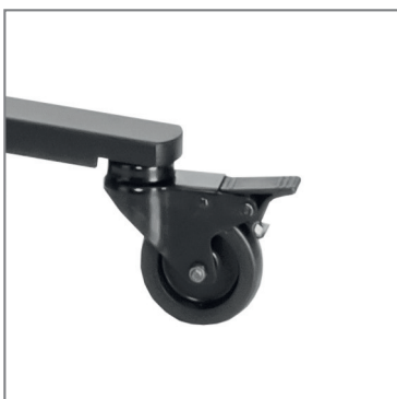
inkl. Rollenset, feststellbar