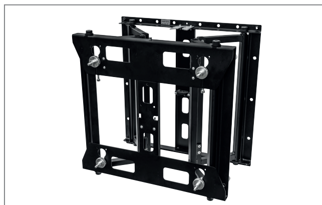
adaptierbar an VWH-5 Videowallhalter (Art.-Nr.: 1628)