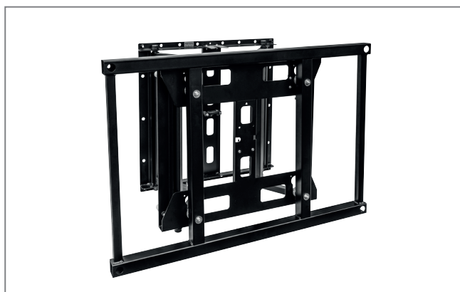
Montagebeispiel, VWH-5 mit Adapterrahmen